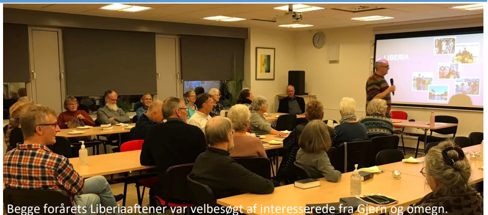
Begge forårets Liberiaaftener var velbesøgt af interesserede fra Gjern og omegn.